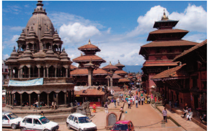
gada, Asistencia y Traslado al hotel